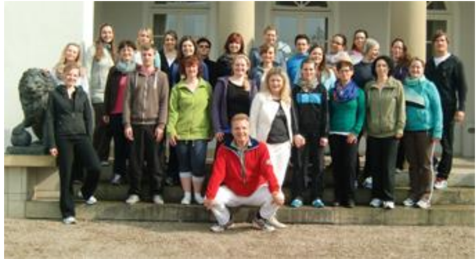
Inhouse-Seminar: Orth. Rückenschule n. Dr. Brügger in Großtreben-Zwethau