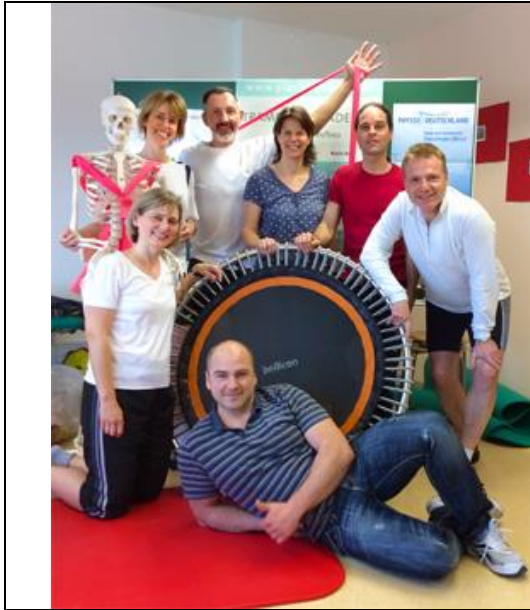
Trampolin Basic-Kurs in Landstuhl

Hier seht Ihr die glücklichen Gesichter der Absolventen der vergangenen Kurse: