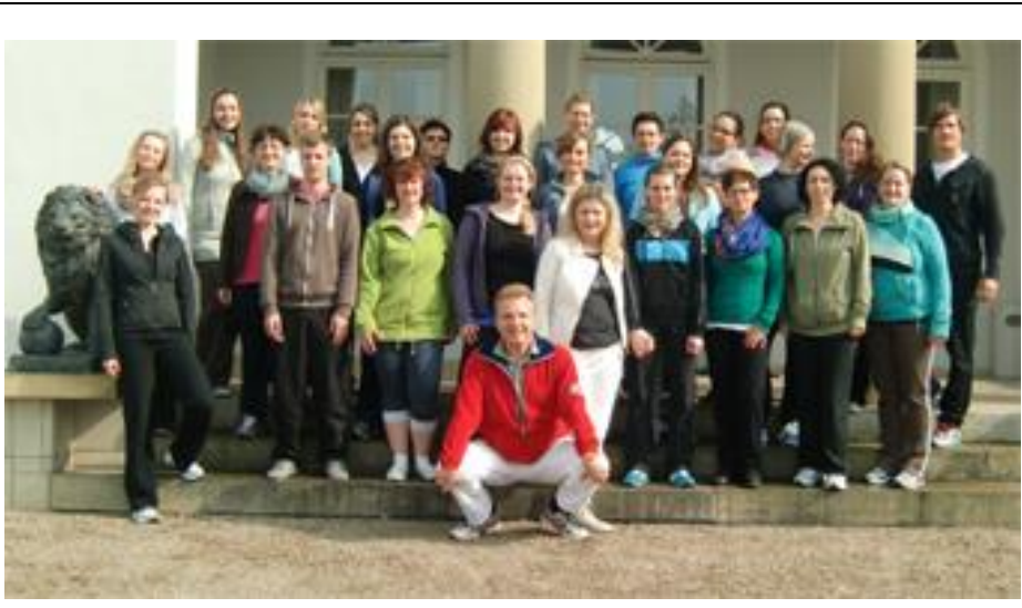
Inhouse-Seminar: Orth. Rückenschule n. Dr. Brügger in Großtreben-Zwethau