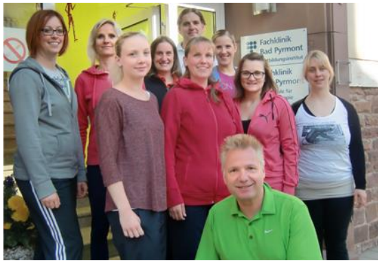
Orth. Rückenschule nach Dr. Brügger in Bad Pyrmont