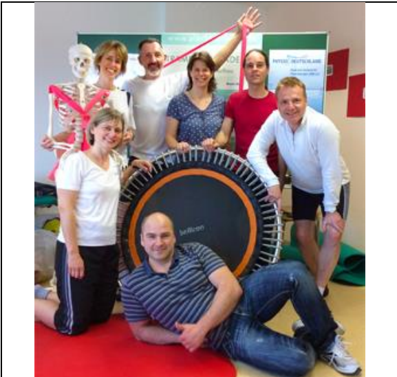
Trampolin Basic-Kurs in Landstuhl