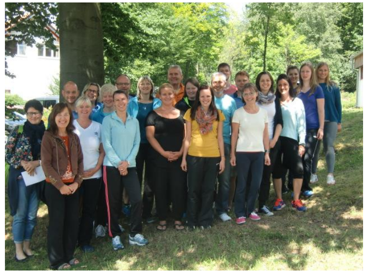
Orth. Rückenschule & Refresherkurs in Gersfeld