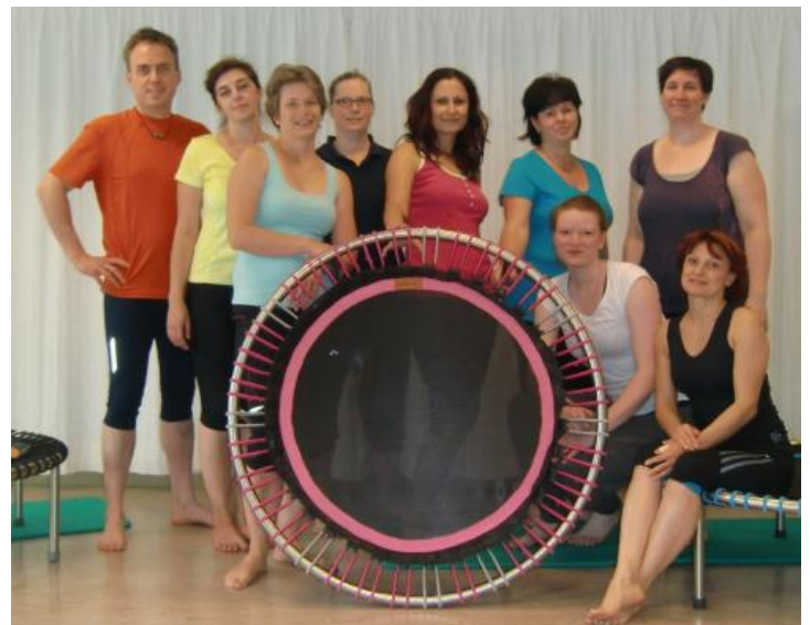
Trampolinkurs Basic in Leipzig